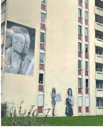
Une nouvelle image.