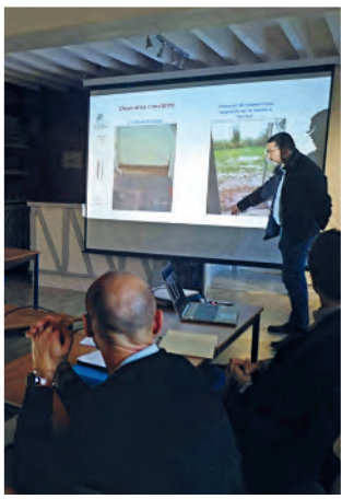
6 mois de travaux à Hanvoile en 2023.

C es travaux font suite à une expertise judiciaire et vont porter sur la modification de la gestion des eaux pluviales du bâtiment et de la gestion des infiltrations provenant des remontées de nappes et de ruissellement des eaux. Les travaux sont de plusieurs natures et obligent l'OPAC de l'Oise à vider totalement le bâtiment. Chaque famille concernée sera accompagnée tout au long du processus de relogement et les déménagements sont pris en charge par l'office. C'est l'agence de Beauvais qui est à l'écoute des locataires d'Hanvoile : agencebeauvais@opacoise.fr - 03 44 10 14 90.