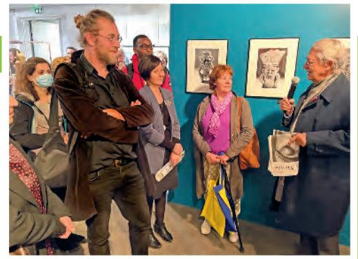
Vernissage de l'exposition à Compiègne.

Depuis le 26 septembre, photos d'habitants et d'œuvres d'art tapissent les façades d'immeubles dans les quartiers Pompidou et Royallieu, à Compiègne.