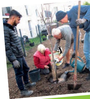
Une belle journée au jardin de Winfried.

V oilà qui a été l'occasion de constater que la récolte est bonne sur ce site, avec notamment de superbes potirons ! Repas, ateliers tote-bags, jeux de société, dessins pour les enfants, ont rythmé cette journée conviviale passée au jardin. Un rendez-vous auquel ont participé des représentants de l'OPAC de l'Oise et de l'association "Au jardin de Winfried", ainsi que des résidents.