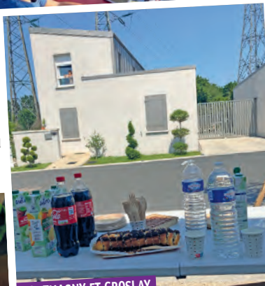
MONTMAGNY ET GROSLAY