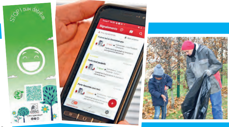
Les bons et mauvais gestes.

La stratégie de l'office en matière de déchets est basée sur 4 piliers : le curatif, l'aménagement, la sensibilisation et la participation, et la répression. Une initiative née du constat suivant : en 2022, la moitié des troubles locatifs, soit 3411 faits, concernaient les déchets. Face à ce problème devenu récurrent, l'OPAC de l'Oise a voulu réagir. La mise en place de ces gardes assermentés s'inscrit dans le volet répression. L'assermentation a pour