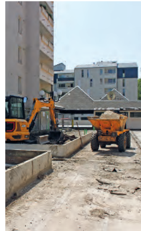
Les délais sont respectés.

Le réaménagement du niveau -2 du parking souterrain est terminé et les locataires peuvent à nouveau y accéder. Les deux logements et la façade « témoins » ont été présentés en juin. Après validation par les équipes de l'OPAC de l'Oise, les locataires seront invités à découvrir ces travaux. Pour rappel, le programme de ces travaux de renouvellement urbain est dense: création de locaux commerciaux en front de rue, avenue Salvador Allende, de logements neufs, réhabilitation de 168 appartements et des façades de 7 immeubles, réaménagement de la place des Tilleuls et des deux niveaux de parking souterrain.