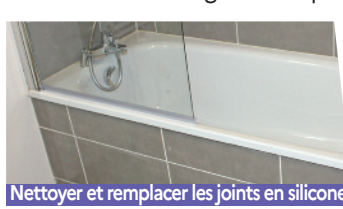
Nettoyer et remplacer les joints en silicone

vous apprendrez aussi comment détartrer un mousseur de robinet, garantir une bonne ventilation et changer vos joints de salle de bains. Un bon entretien permet, non seulement de réaliser des économies, mais aussi de prolonger la durée de vie de vos équipements.