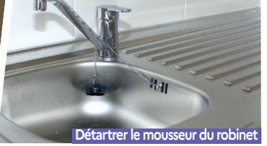
Détartrer le mousseur du robinet