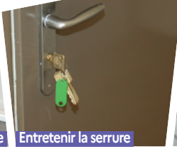
Entretien la serrure