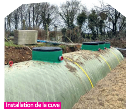
Installation de la cuve

C'est fait! L'opération de mise en conformité de la station d'épuration à Abancourt est terminée, rue des Érables. Lancés en décembre dernier, les travaux d'un montant de 169 597 € ont été réalisés par l'entreprise Serpa d'Évreux et intégralement financés par l'OPAC de l'Oise. C'est un vrai gain de confort pour les 20 familles concernées et les riverains.