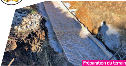
Préparation du terrain

C'est fait! L'opération de mise en conformité de la station d'épuration à Abancourt est terminée, rue des Érables. Lancés en décembre dernier, les travaux d'un montant de 169 597 € ont été réalisés par l'entreprise Serpa d'Évreux et intégralement financés par l'OPAC de l'Oise. C'est un vrai gain de confort pour les 20 familles concernées et les riverains.